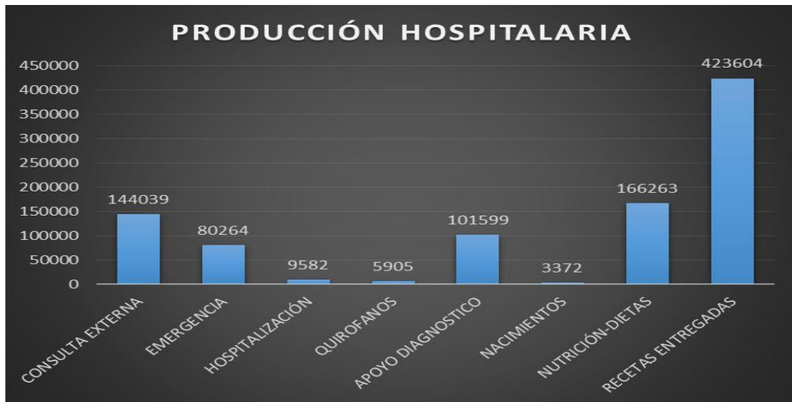
Gráfico 01: Producción Hospitalaria en el periodo enero – diciembre 2025

Fuente: Sistema Md SOS año 2025 Elaboración: Unidad de Admisiones y estadística, año 2025