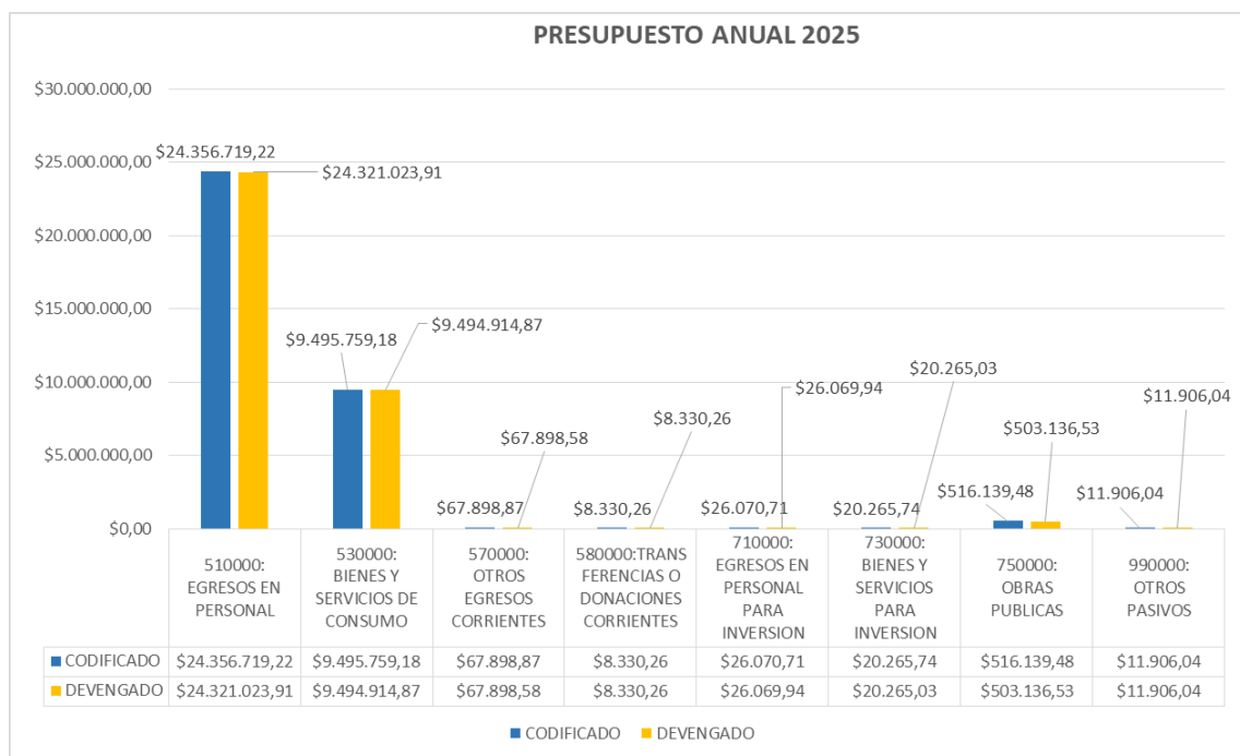
Gráfico 02: Ejecución presupuestaria en el periodo enero – diciembre 2025

En el ejercicio fiscal 2025 esta Casa de Salud ejecutó el 99,86% del total de presupuesto asignado.